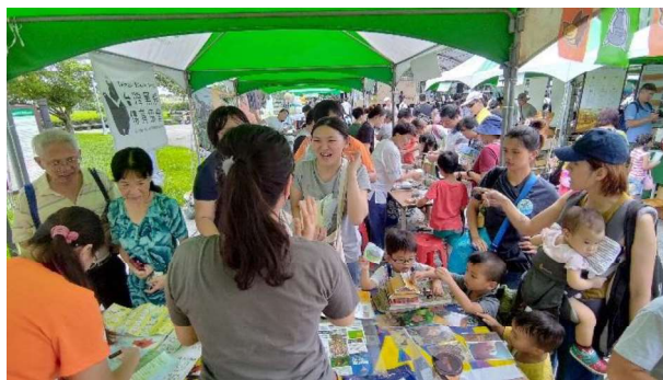
台北生態保育活動