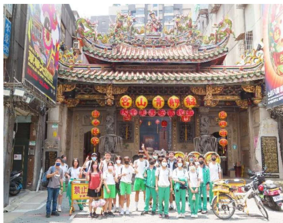
2023年台北市艋舺蝙蝠文化走讀