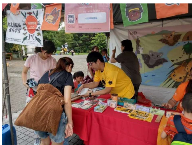
動物園動物夏夏叫