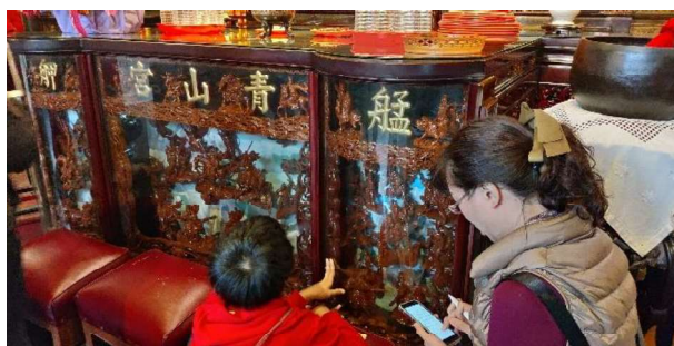
艋舺蝙蝠文化活動