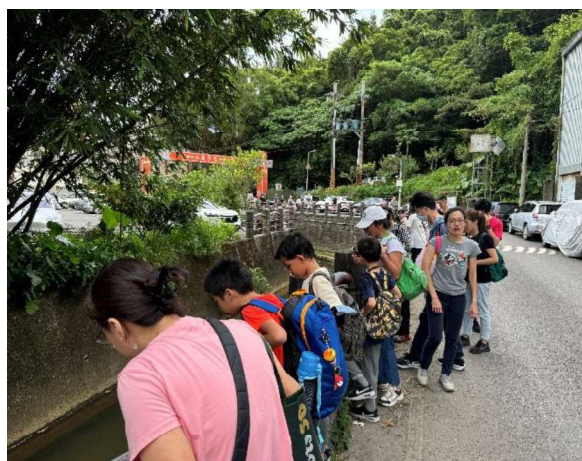
2024年台北市內湖賞蝠活動