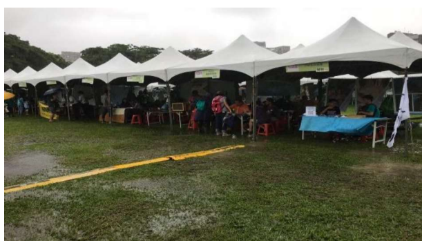
大安森林公園生態博覽會