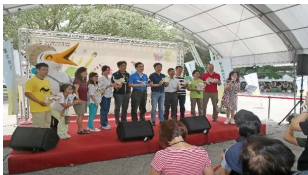
台北生態保育活動