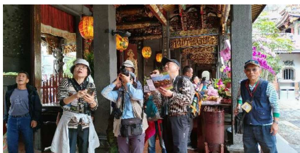
大龍峒蝙蝠文化活動