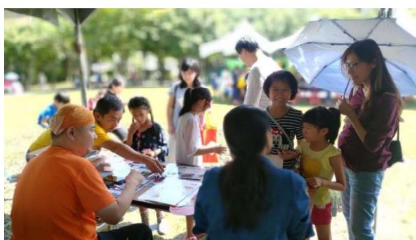
大安森林公園生態博覽會