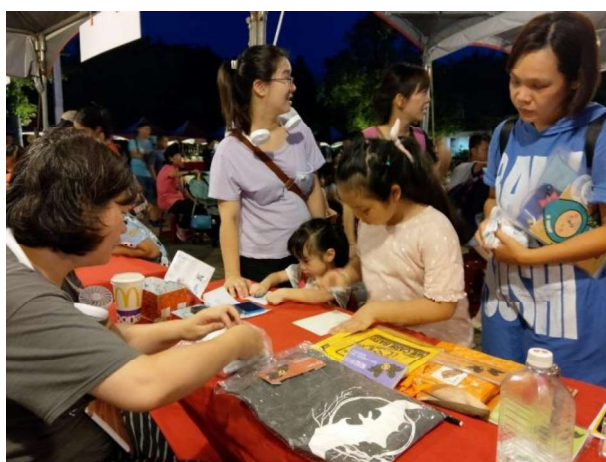
動物園動物夏夏叫