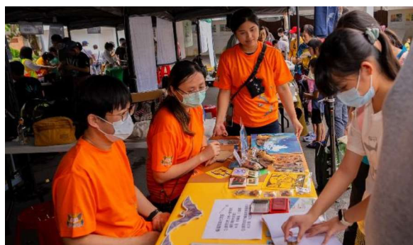
2024年台北市大安森林公園攤位活動