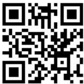
新生分發入學作業平台 (優先入學的家長不要填)