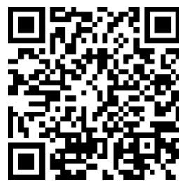
114 學年度 國七新生資料建置