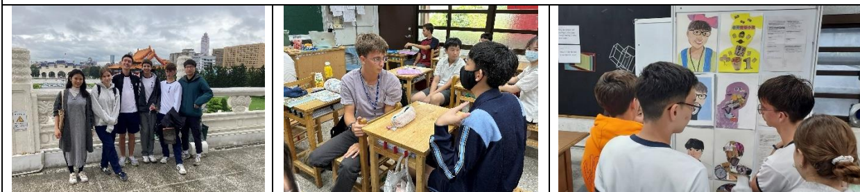
外籍協同教師課程活動互動