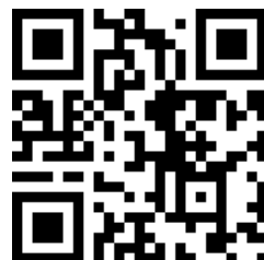
學生安全健康上網