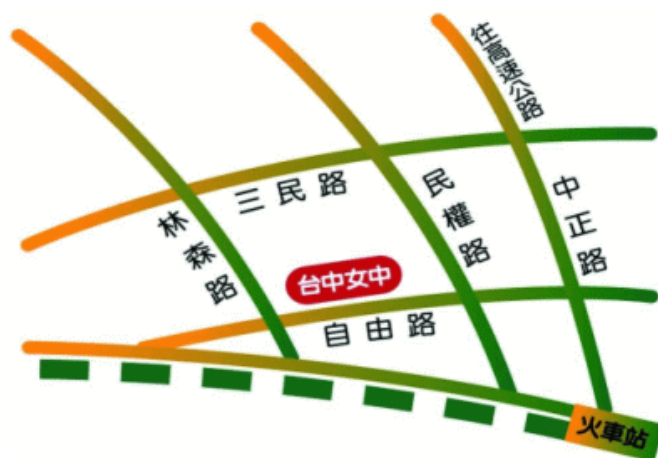
臺中市立臺中女子高級中等學校 110 學年度校園配置圖