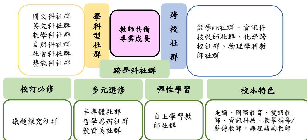
圖2 教師專業學習社群