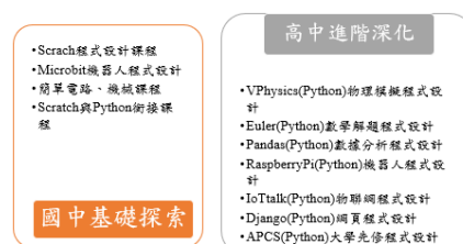
圖4 本校六年一貫資訊跨領域教師專業發展

A. 資訊跨領域社群：以「STEAM教育，培育程式設計未來人才」為目標，設計六年一貫跨領域合作學習整合課程，整合高國中資訊與生活科技師資成立的社群，每年國中辦理機器人大賽並向上銜接高中數位科