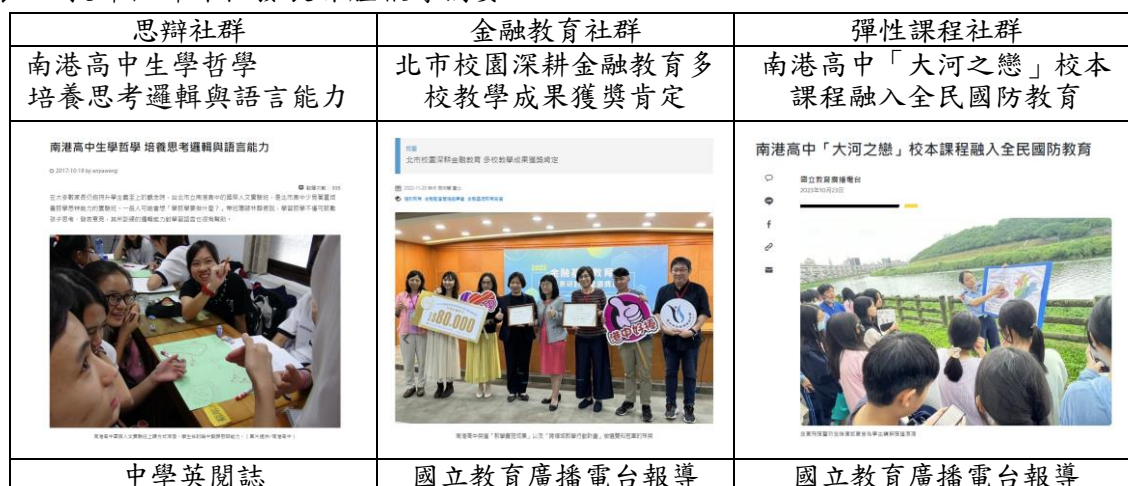
表15.教師社群課程發展媒體報導摘要